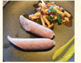
淡路島ゴールデンポークのソーセージ

Shrimp and seasonal vegetables Ajillo 海老と季節野菜のアヒージョ 1,070