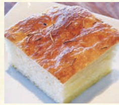
シェフの手作りフォカッチャ