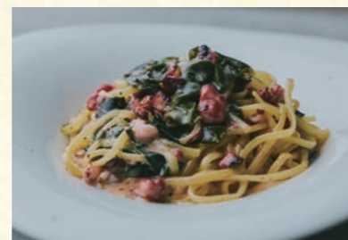
Local octopus and seaweed, Sansyo flavor ⑪ 地ダコと由良産ワカメのクリーム ・山椒風味

【おすすめ生パスタ】 タリアテッレ・バッバルデッレ・ほうれん草タリアテッレ ・コンキリエ