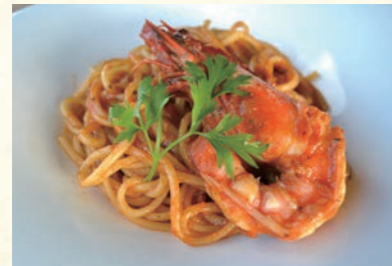
Red leg shrimp, basil flavor ⑳ 足赤海老のトマトソース バジル風味 1,880 しっかりとした味と歯ごたえ抜群の淡路の海老 フレッシュグループ産の香り高いバジルと共に。 【おすすめ生パスタ】 O型パスタ・エッグ型パスタ・カネストリ