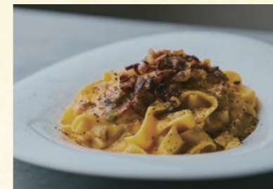
Homemade bacon carbonara ⑮ 自家製ベーコンカルボナーラ