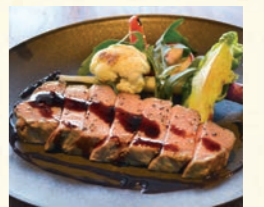
淡路島ポークの炭火ロースト

Roasted Awaji pork with orange gastric sauce 淡路島ポークの炭火のロースト オレンジガストリックソース 1,280