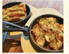
地魚 or 地タコ香草パン粉焼き

Prosciutto and mascarpone baguette 生ハムマスカルポーネのバゲット 440