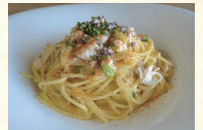
Fresh fish milt and white spring onion with dried mullet roe and Shiso ㉕ 鮮魚の白子と白ネギのからすみ添え 穂じその香り DAN-MENの定番とも言える白子のパスタ。 当店自慢の一皿です。 【おすすめ生パスタ】 スパゲッティ・タリアリーニ・イカスミタリオリーニ 1,820