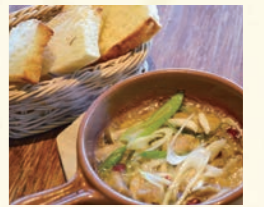
鶏セセリ肉のアヒージョ

Awaji Island shirasu & tomato Ajillo 淡路島しらすとトマトのアヒージョ 590