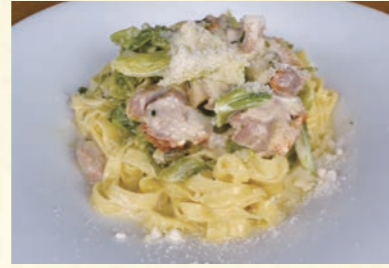
Awaji chicken and spring cabbage with cheese ㉕ 淡路鶏と春キャベツのクリーム チーズ添え 春キャベツの甘みと淡路鶏との相性は抜群です。 【おすすめ生パスタ】 タリアテッレ・ほうれん草タリアテッレ・カネストリ 1,680