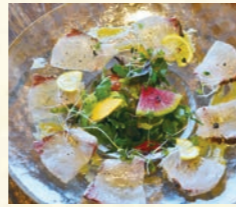
本日の鮮魚のカルパッチョ

Fresh seasonal local vegetables Bagna cauda 淡路島の新鮮野菜のバーニャカウダ 1,100