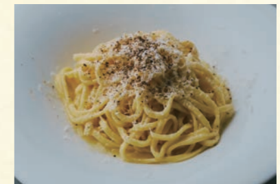
Carcho epepe ⑯ カーチョエペペ

【おすすめ生パスタ】 フェットチーネ・タリアテッレ・バッバルデッレ ・カネストリ