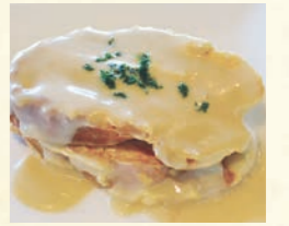
とろーりモッツアレラのバゲットサンド

Melted mozzarella baguette sand とろーりモッツアレラのバゲットサンド 450