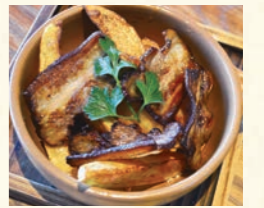
自家製ベーコン&ポテト

Homemade bacon and potats 自家製ベーコン&ポテト 690