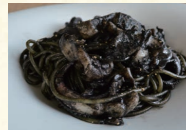
Squid ink ⑱ イカスマ