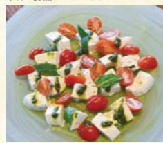
淡路島産トマトと淡路島産モッツアレラのカプレーゼ

Awaji Island tomato & mozzarella Caprese 淡路島トマトと淡路島産モッツアレラのカプレーゼ 1,300