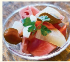
淡路島野菜のピクルス

Fresh seasonal local vegetables Bagna cauda 淡路島の新鮮野菜のバーニャカウダ 1,100