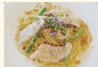
Sakura sea bream marinated in shio koji with dried mullet roe ㉔ 桜鯛の塩こうじ からすみ添え 旨味を増した鯛を軽く炙り、アスパラと共に オイルで仕上げました。 【おすすめ生パスタ】 スパゲッティ・タリアリーニ・イカスミタリオリーニ 1,880