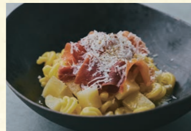
Prosciutto and potato ⑭ 生ハムとじゃがいものたっぷりチーズ

【おすすめ生パスタ】 モッチリーニ・ほうれん草タリアテッレ ・リッシマファルディーネ・カネストリ