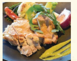
淡路島鶏モモ肉のソテー

Sauteed Awaji chicken with seasonal vegetables tomato sauce 淡路島鶏モモ肉のソテー 季節の野菜のトマトソース 1,150