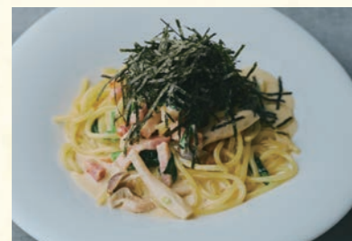
Bacon and shimeji mushroom Wasabi flavor ⑫ ベーコンとしめじのわさびクリーム

【おすすめ生パスタ】 リングイネ・モッチリーニ・コンキリエ ・リッシマファルディーネ