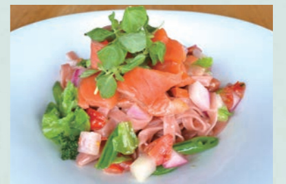
Awajishima cherry salmon primavera ㉓ 淡路島サクラマスのプリマベラ 1,780 季節限定のスペシャル生パスタを使用、 旬の野菜と軽く燻製したサクラマスの春らしい一品です。 【使用生パスタ】 さくらタリアテッレ