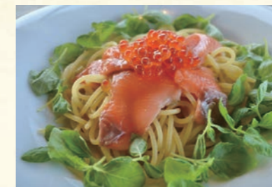
Awajishima cherry salmon sashimi pasta ㉙ 淡路島サクラマスのお刺身パスタ 淡路島福良産のサクラマスは春の定番食材! お刺身風パスタで。 【おすすめ生パスタ】 スパゲッティ・イカスミタリオリーニ・カザレツェ 1,740