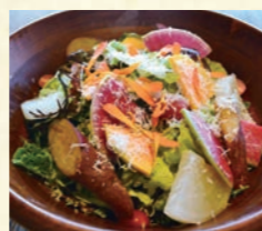
淡路島の旬野菜を使用したシェフのきまぐれサラダ

Chef's special local vegetable Salad 淡路島の旬野菜を使用したシェフのきまぐれサラダ 860