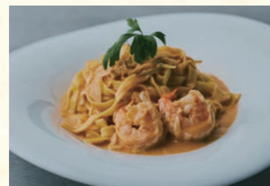
Shrimp ⑩ エビクリーム