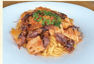
Firefly squid and bamboo shoots with leaf buds ㉑ ホタルイカと筍のトマトソース 木の芽添え ホタルイカの旨みを十分に味わえるパスタです。 【おすすめ生パスタ】 タリアリーニ・イカスミタリオリーニ・コンキリエ 1,740