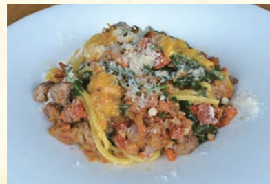
Lamb with cheese, lemon flavor ㉓ 仔羊のラグー チーズ添え レモン風味 1,820 島の野菜に仔羊を合わせることで、野菜の旨味に 仔羊のワイルドさがスパイスに。 【おすすめ生パスタ】 エッグ型パスタ・タリアテッレ・カネストリ