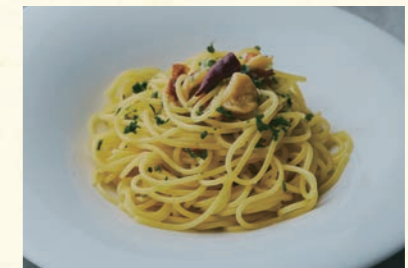
Peperoncino ⑲ ペペロンチーノ

【おすすめ生パスタ】 スパゲッティ・O型パスタ・イカスマタリオリーニ ・カザレツェ